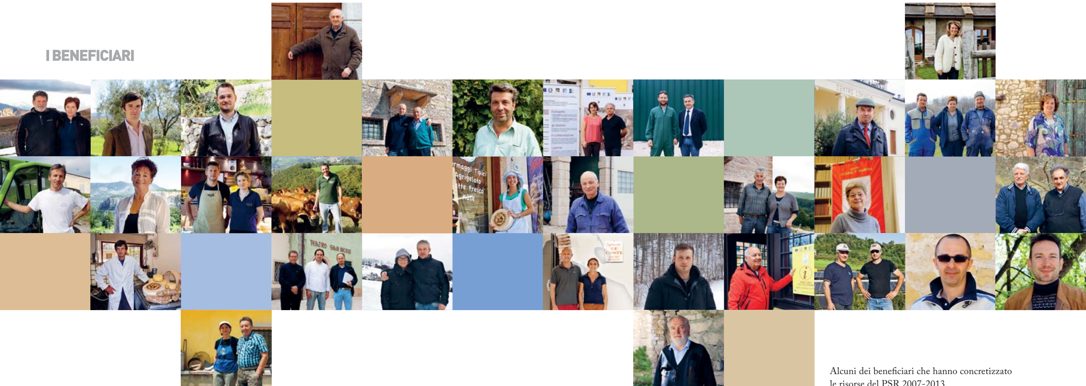
Alcuni dei beneficiari che hanno concretizzato le risorse del PSR 2007-2013.